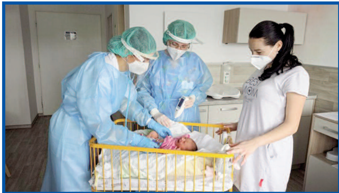
V porodnicích to v době koronaviru nemají lékaři ani pacientky snadné.