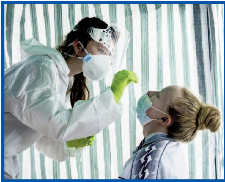
Nic to není.

Přicházím do areálu nemocnice o necelých patnáct minut dřív. Jednak proto, že jsem přecenila čas cesty, jednak